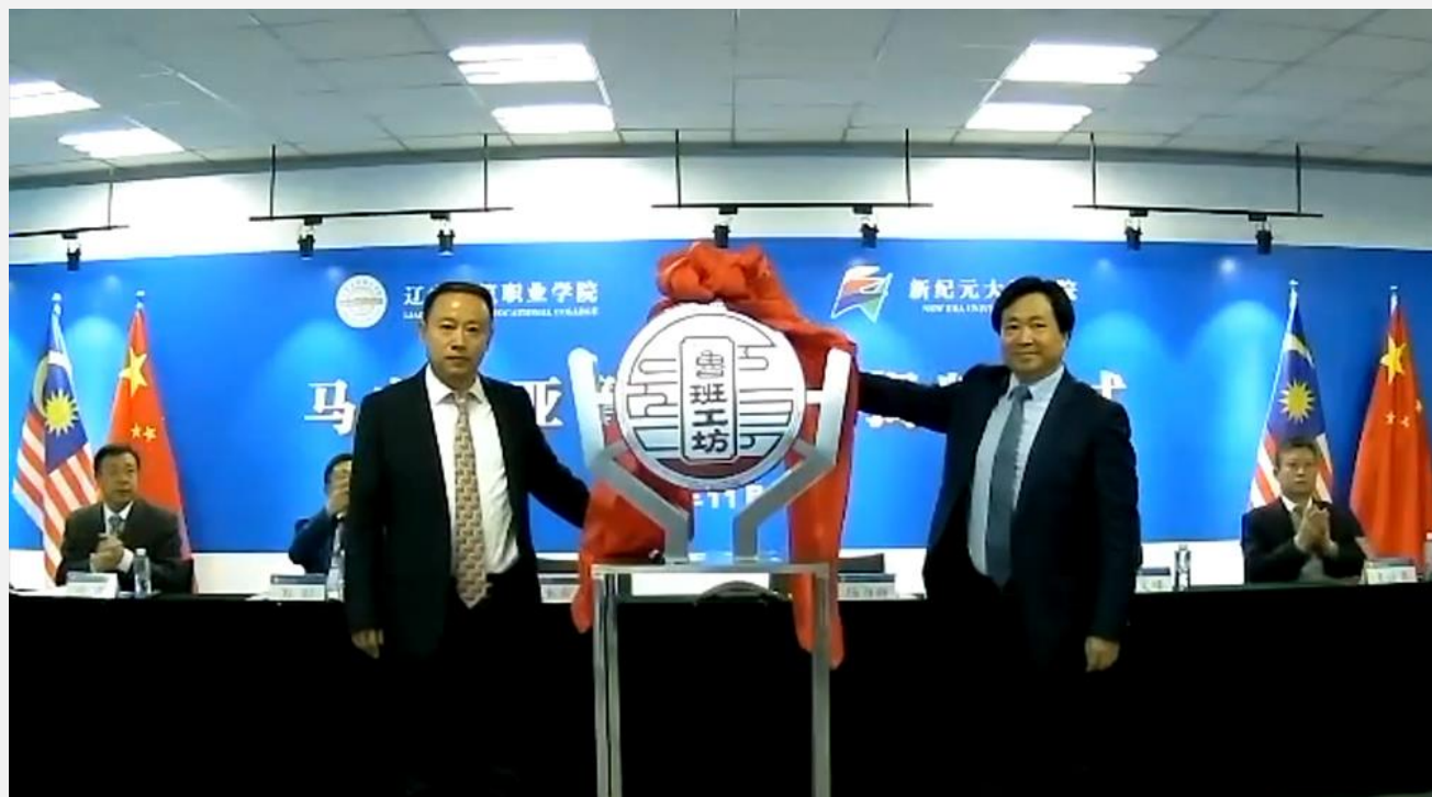
2020年11月13日，中国辽宁省教育厅副厅长杨为群先生（左）及中国辽宁建筑职业学院党委书记刘长新教授（右）为马来西亚鲁班工坊揭开牌匾。